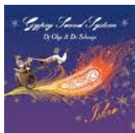
Iskra (Gypsy Sound System)