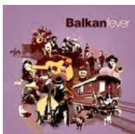
Balkan Fever (Wagram)