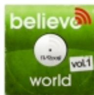
World Vol. 1 (Believe)